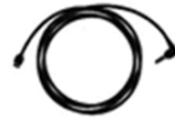
オーディオケーブル(黒)